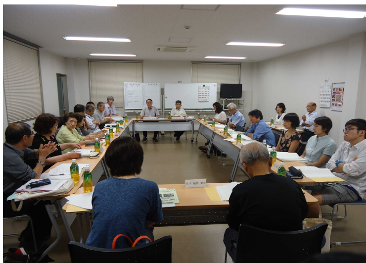
熱心に討議される地域協議会委員の皆さん（第3回協議会）

平成28年度第3回地域協議会では、 前回に引き続き、「地域のお宝発掘・ 発展・発信事業」についての協議が 行われました。