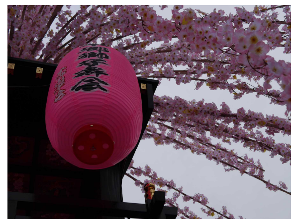
提灯は桃色！モノクロだと伝わりにくいですが、桜の淡い色に映えてとてもきれいでした。