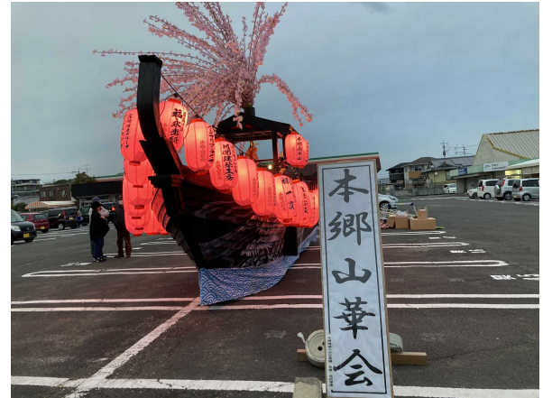
本郷山華会の看板とともに正面から見たところ。