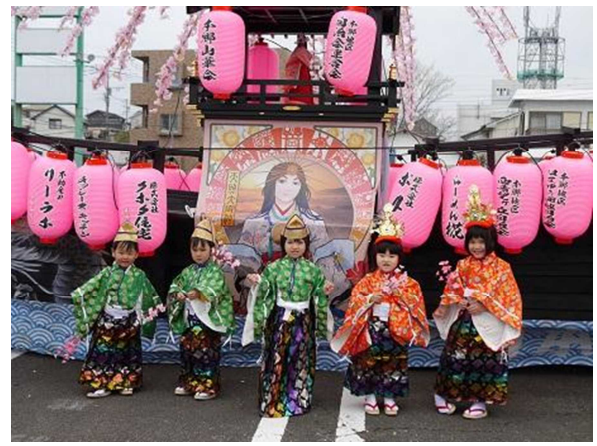
華やかな稚児衣装の披露。かわいすぎて皆にっこり。