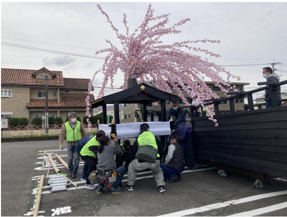
みこし舟に山華山車を載せます。よいしょ～。