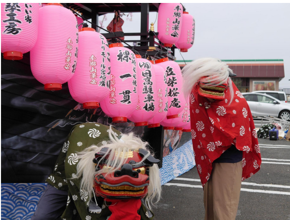
獅子舞は山華山車との相性もよく盛り上がりました。