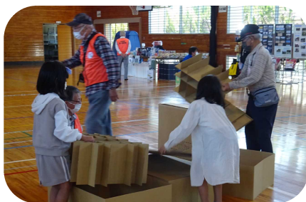
段ボールベッド組み立て