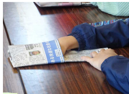
新聞スリッパ作り