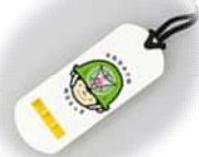
スタンプラリー賞品