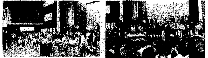
【学校での発表会の様子】

一つのことをみんなで創り上げる大変さや終わった後の達成感など多くのことを感じ学んだ5年生でした。今後のさらなる活躍に期待しています。