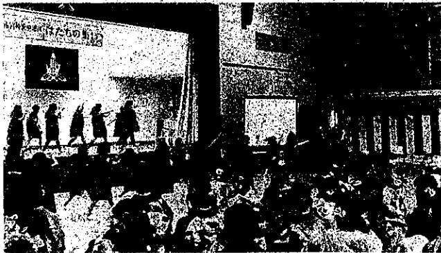
【堂々と踊っている4年生】

いつも元気いっぱい4年生ですが、会場に入ると晴れやかな雰囲気緊張した様子も見られる中、気持ちを込めて精いっぱい踊りました。多くのカメラや手拍子も受け、気持ちよく踊り、終わった後も満足した表情でした。会場の方からも「すごくよかった。」「ありがとう。」と多くの言葉をいただきました。この伝統をこれからも受け継いでいきたいです。