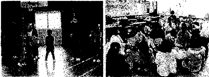
【昔の遊び交流会の一コマ】

交流会が始まると普段することのない遊びに夢中になり時間を忘れて遊んでいました。やり方やコツを真剣に聞き、できるようになると大喜びでした。終わったとは感謝の気持ちをお手紙に書いて送りました。たくさんの笑顔の交流会をこれからも続けていけるといいです。ご協力ありがとうございました。