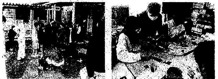
【ものづくり教室の様子】

また、12月12日(火)には県の教育委員の学校訪問が行われ、江平っ子の様子を見ていただきました。礼儀正しく、真剣に学習に取り組む様子に多くのお褒めの言葉をいただきました。