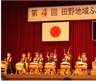
みなみこども園の園児による 和太鼓演奏

9月17日(月・祝) 暑さが残る秋晴れの日田野文化会館にて、75歳以上の方を対象に敬老の日イベントが開催され152名の方が参加されました。