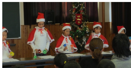
◆ 平成29年12月に開催されたクリスマス会