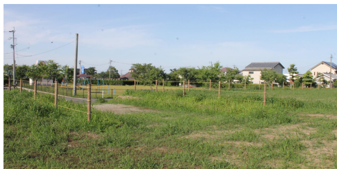
※あけぼの地区市有地現状写真（平成30年5月撮影）

あけぼの地区市有地の今後の活用について検討する小委員会の人選等について協議しました。