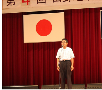
田野中学校の生徒さんによる 詩吟「事に感ず」