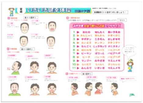
※ポスターイメージ

3枚1セットで絵を見ながら体操が実践できます。 DVDやCDの再生機器が無い場合などに活用いただけます。