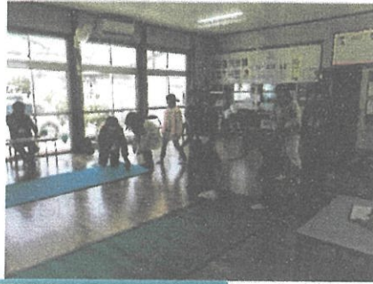
3/2(土) ふれあいボウリング大会

今年度2回目のボウリング大会を実施しました！木曜会の皆様にボランティアで来ていただき、アドバイスやサポートをして頂きました。子どもたちは、ストライクやスペアが出るとみんなで大盛り上がり！木曜会の皆様ありがとうございました！