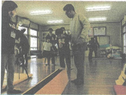
2/18(日) パパとあそぼう(かみむらスポーツ)

大好きなパパとふれあい遊びや、跳び箱・平均台・鉄棒などで身体を動かして楽しく過ごしました。お父様方、お疲れ様でした！