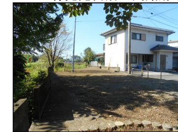
No.5011 緑光苑自治公民館跡地