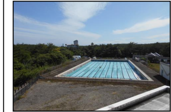
No.4022 石崎の杜歓鯨館 (屋外プール)