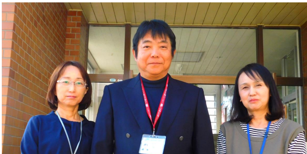
社会教育指導員（事業）

大塚公民館は、4月1日から名称が「大塚地区交流センター」に変更となりました。職員は今年度も引き続きこの3人で業務にあたらせていただきます。交流センターへのお問い合わせ、ご質問等、窓口でお気軽にお声かけください。一年間よろしくお願いたします。