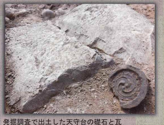
発掘調査で出土した天守台の礎石と瓦(平成29年度調査)