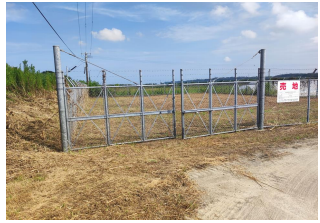
No.4070 佐土原町取水場電気棟跡地