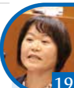
19 令政会 時任 砂織

答 令和4年度末現在の企業債残高は、水道事業が約355億円、公共下水道事業が約708億円となっており、企業債利息は、水道事業が約31億円、公共下水道事業が約49億円となっています。