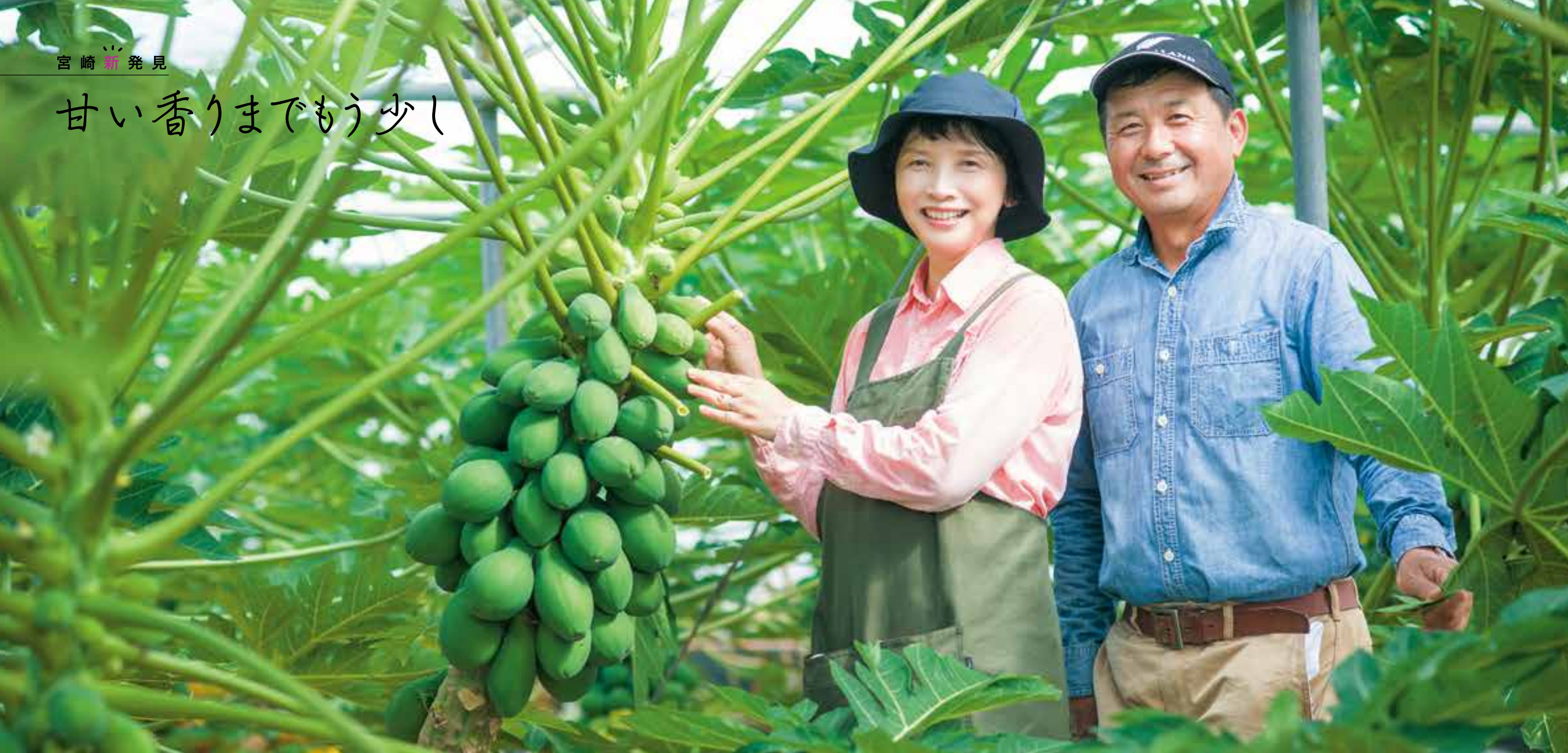
取材協力:JA宮崎中央パパイア研究会