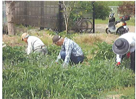
畑のお手入れをしました。H25年5月9日