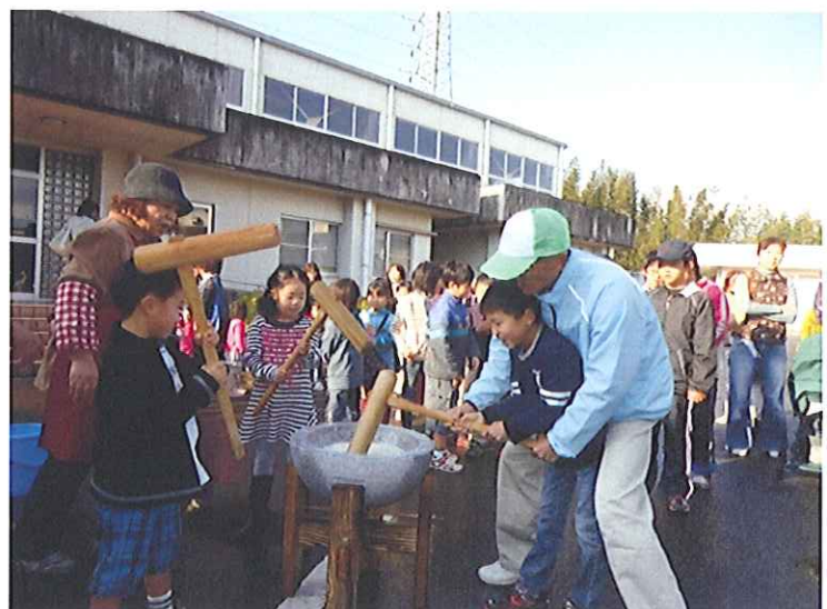
もちつきふれあい会：H24年12月24日実施