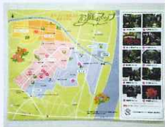
花の庭づくりコンクールマップ