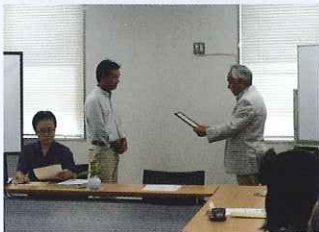
花の庭づくりコンクール表彰式