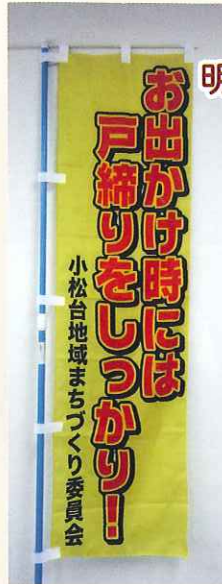
防犯啓発用のぼり

各自治会幹部を中心に自主防災隊研修会・災害図上訓練(DIG)・防災研修会を行いました。防犯啓発用の幟を作り、それぞれの自治会で要所に設置しました。青パト講習会を複数回開き、防犯パトロール会員の増員を図りました。今後とも犯罪のない明るい街づくりをめざし、防犯パトロールも充実していきます。災害時対応積立金も目標額に向けて積立せていき万一の時に備え、備蓄品の購入配布も図っていきます。