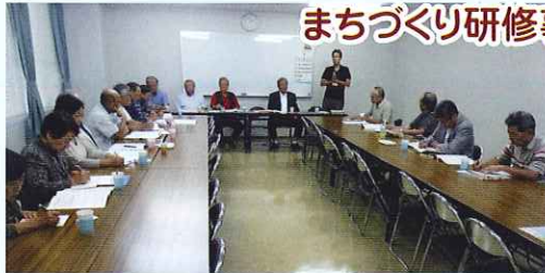
北九州市若松区第22区自治会での研修の様子