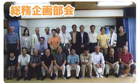
視察研修(茶屋の原自治区会)