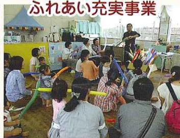
ふれあい充実事業