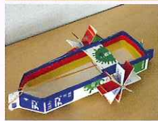
親子工作教室／いろいろなものを作りました。