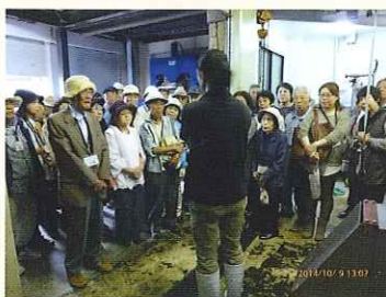
高齢者日帰り旅行／西の都アグリ館などバスに乗って行きました。