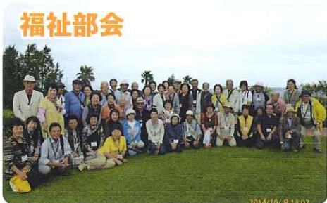
高齢者日帰り旅行