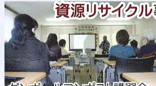
資源リサイクル事業