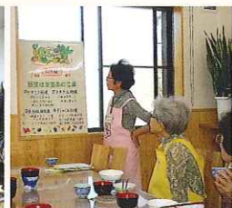
シニア料理教室 栄養の勉強もします。