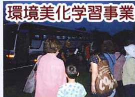
環境美化学習事業