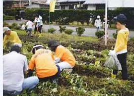
畑の草取り／雑草をとった後は畑らしくなりました。