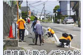
環境美化散歩／ゴミを拾いながら小松台地域を歩きました