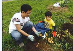
ジャガイモ収穫とさつまいも植え付け／植え方も習いました。