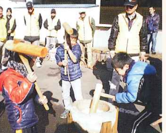
もちつきふれあい会 みんなでおもちをつきました。