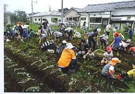
食育農業体験事業

①環境美化学習事業では私たち地域の環境を理解し美しく住み良いまちづくりを目指します。②食育農業体験事業では子どもから大人まで一緒になって苗植えを体験し、収穫の喜びを実感する。③資源リサイクル事業ではゴミを再利用することでゴミの減量化を目指し資源の大切さを実感する。以上の活動を27年度も計画中です。皆様にも是非参加していただき楽しく活動を進めていきましょう。