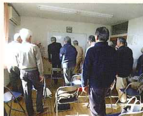
料理教室では健康のためのロコモ予防の体操を体験しました。