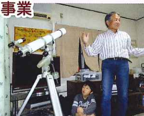
天文教室／大きな天体望遠鏡で星を見ます。