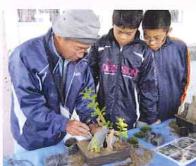
ふれあいin小松台地域の技人が子どもたちにいろいろ体験させてくれました。