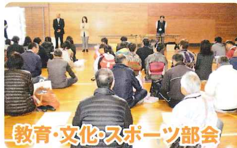
ふれあいin小松台 講師説明