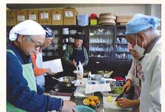
男性料理教室 美味しくできました。