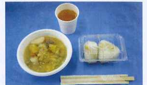
さつまいも入り豚汁、さつまいもはんのおにぎり、塩茹で落花生