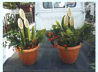
出来上がり作品(ユズリハ、千両などは持参したもの)