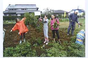
収穫祭いっぱいといれたよ!