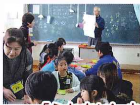
「ふれあいin小松台」共催事業

教育・文化・スポーツ部会を立ち上げて丸6年となりました。小松台小学校の学校行事である「ふれあいin小松台」の講座部門を、地域の方々が支えてくださっているおかげで、児童からは喜びの声を、また先生方からは感謝の言葉をいただいています。それが、支えてくださった地域の方の生きがいにもなっています。子どもたちの笑顔は地域住民の宝なのですね。みなさんも一緒に宝を大切に育てていきませんか? 部会への参加お待ちしております。