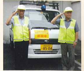
防犯パトロール活動/パトロール隊員が巡回しています。