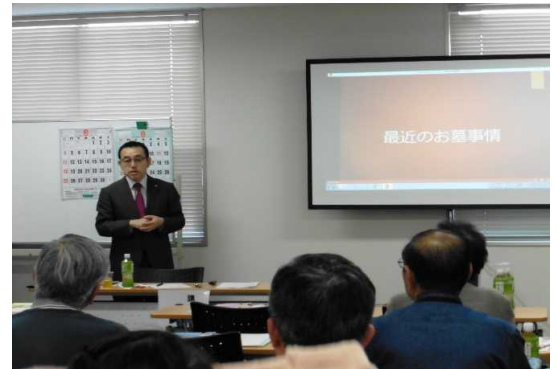
大人のための実用講座の様子