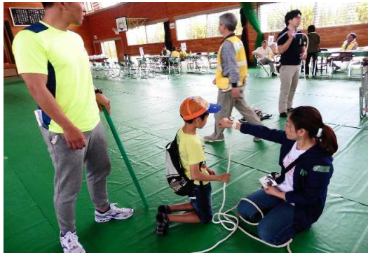
防災訓練でのロープワーク