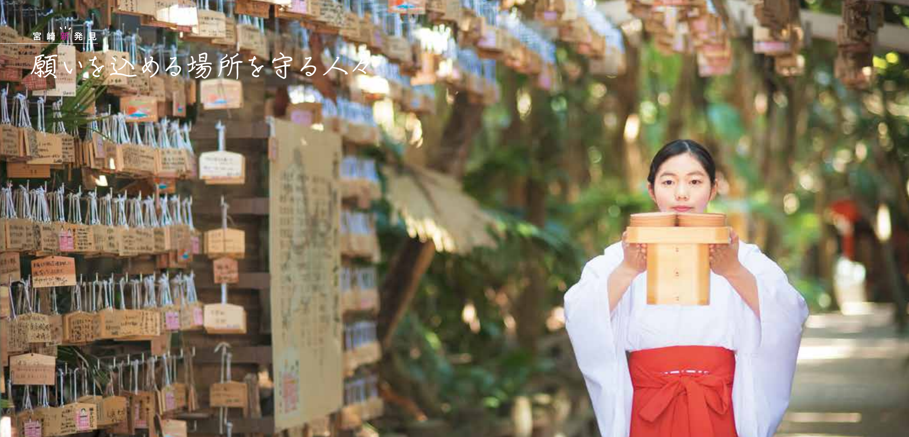
取材協力:青島神社