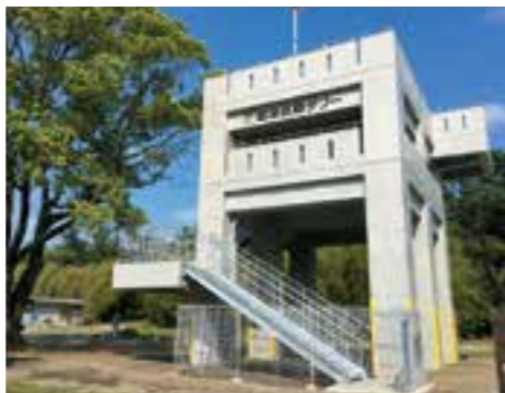
平成27年4月 かきはら 蛸原避難タワーが開所

昭和27年 宮崎市生生まれ 昭和49年 宮崎県立農業大学校を卒業 昭和49年 佐土原町役場に入庁 平成10年 佐土原町長に就任。2期務める 平成22年 宮崎市長就任 平成26年 宮崎市長2期目就任 平成30年 宮崎市長3期目就任