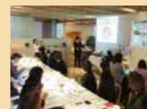
「日本農業遺産」出前講座