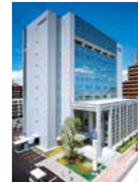
宮崎太陽銀行本店