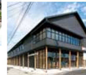
観光商業施設 青島屋