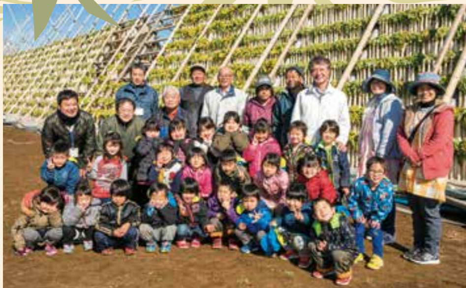
ぎんなん保育園の皆さん