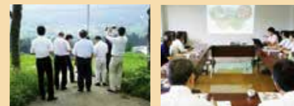
世界農業遺産・高千穂町の視察