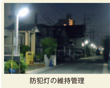
防犯灯の維持管理