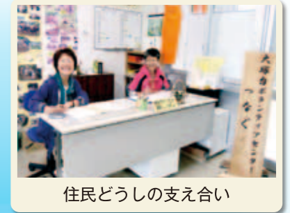
住民どうしの支え合い