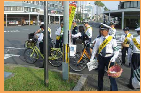
▲ 定期的に街頭キャンペーンを行っています。

安心・安全の自転車保険 TSマークは、自動車安全整備士が「点検・設備」をした安全なものであることを示すマークです。自転車の性能維持のほかに、付帯している保険があり、これを保有することで自転車事故の補償が受けられます。有効期間は、マークに記載されている日付から1年間。自転車でけがをしてしまったり、加害者になったりした時のためにも自転車店でTSマークを貼りましょう。