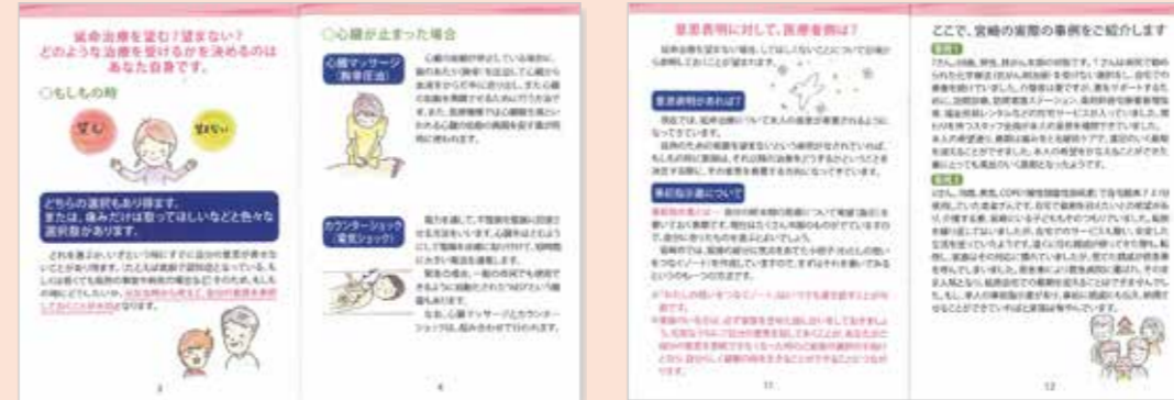
イラストを使って、分かりやすく説明しています

「わたしノート」を正しく活用してもらうため、延命治療やかかりつけ医などの知識をまとめました。