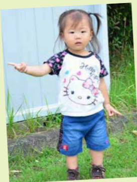
ひかりちゃん 妖怪ウォッチが大好きです!