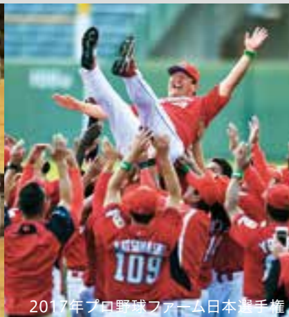
2017年プロ野球ファーム日本選手権