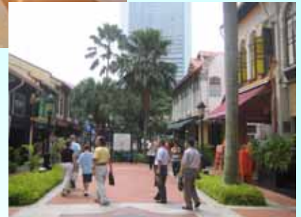
平成18年度 視察状況