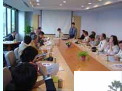
平成17年度 視察状況