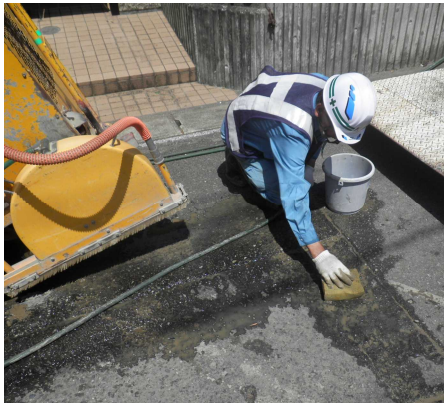
【スポンジによる泥水回収状況】

私達の大切な河川や海等の環境を守るために、これらの泥水については、適切に回収を行うとともに、産業廃棄物として適正に処理していただくようお願いします。