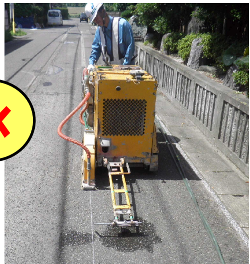
【吸引装置付の機械による切断状況】