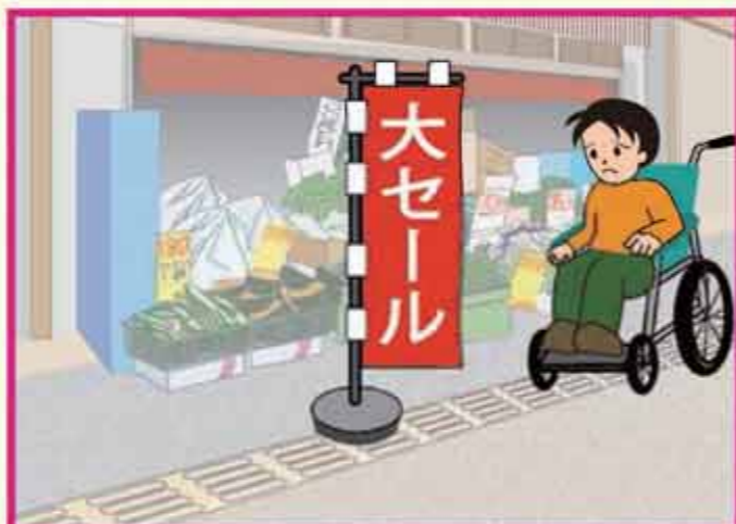
のぼり旗・商品の山積み