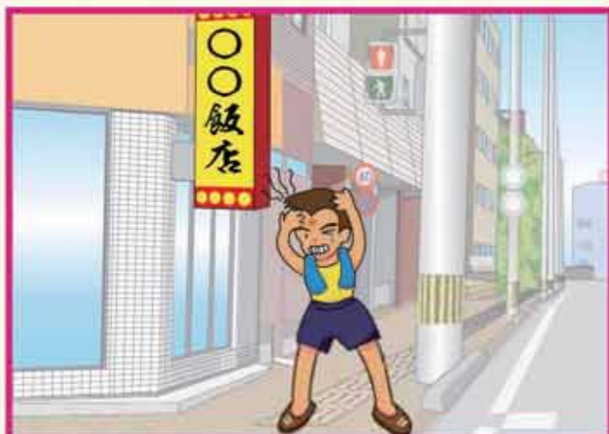
基準に合わない物件