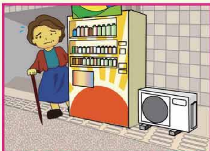
自動販売機・エアコン室外機等