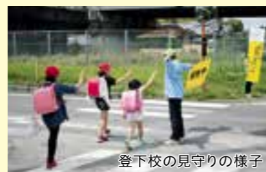
登下校の見守りの様子

市では現在約700人の民生委員・児童委員が活動しており、地域住民の見守りをはじめ、困りごとを抱えている人の相談、福祉制度やサービスの紹介、また行政や専門機関へのつなぎ役など、子どもから高齢者まで、幅広い住民の問題解決の支援を行っています。少子高齢化が進む中で、これらの活動は地域の安全安心を守るために欠かせないものとなっています。