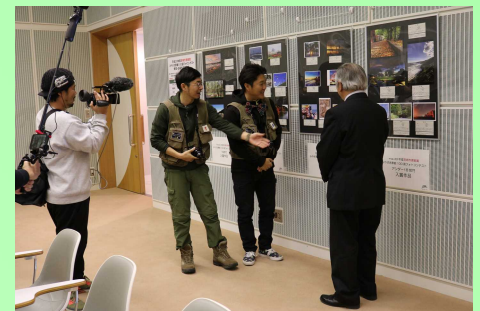
ケーブルテレビ取材