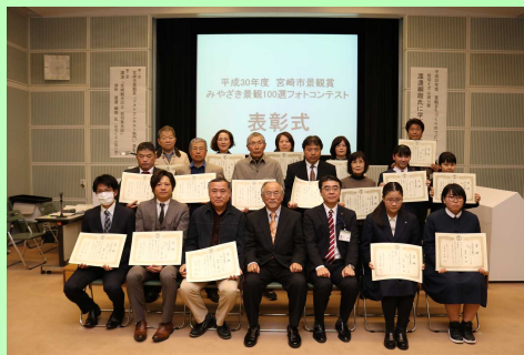
受賞おめでとうございます！