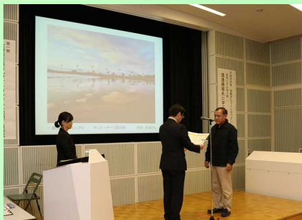
表彰状・副賞授与の様子

また、当日はケーブルテレビの取材もありました。その様子は2月20日(水)17時からのてげテレビにて放送予定です！放送日以降、再放送や公式Youtubeチャンネルで何度もご視聴の機会がありますので、是非ご覧ください！