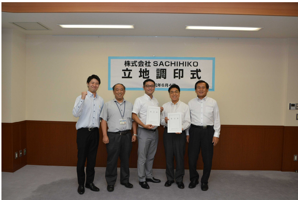
(写真中央が北野代表取締役)