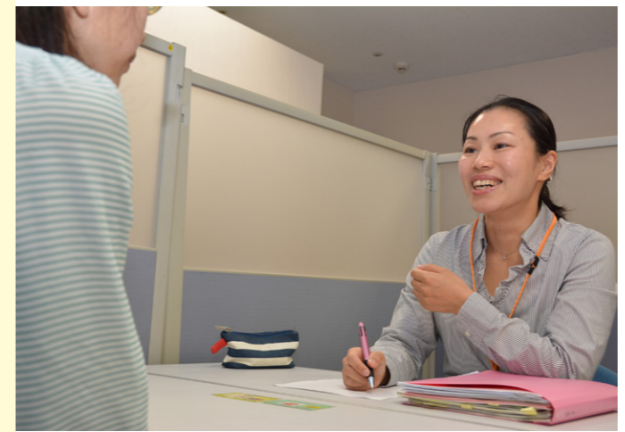
夜間と土曜日に相談に応じます。放課後や業務終了後、仕事がお休みの日などに利用しやすくなっています。

この数年間、宮崎県は人工死産(妊娠12週以降の人工妊娠中絶)率が全国でワースト1位という状況が続いています。背景には、経済的に余裕がないというだけでなく、「最後の月経がわからない」というように自分の身体への関心が薄かったり、避妊の知識が伴っていない、などの状況があります。避妊方法一つをとっても、年齢や状況などによってさまざまな選択肢があります。「あいのて」は、妊娠に不安を持つ人、産みたいけれど何らかの問題で産むのをためらっている人など、その人に合ったアドバイスができるのが強みです。年齢や既婚・未婚、妊娠している・していないに関わらず、安心して新しい命と向き合うためにも先延ばしにせずにご相談ください。県助産師会の助産師がサポートします。