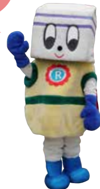
ごみ減量とリサイクルのシンボルキャラクター「リサイクルマン」