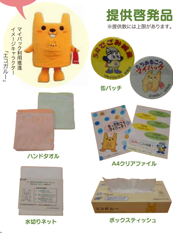
マイバック利用推進イメージキャラクター「エコGalru」