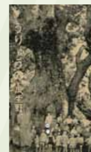
瓜生野八幡神社の樹齢八百年といわれるくす。

瓜生野という地名もむかしこの名はずいぶん古いもので鎌倉時代の建久八年(1197)日向国田原に瓜生野別府百町とあって宇佐神宮領地であったことが明らかである。「中略」南北朝には瓜生野八郎左工門なる者があり、南朝に属し延元元年(1336)迹江の政所に権籠ったが、土持、伊東の北朝方に攻め落とされた。この瓜生野氏は瓜生野に住んでこれを姓としたものことは明らかである。