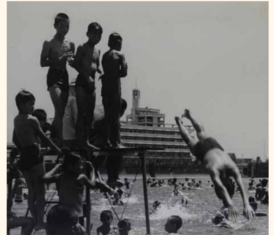
大淀川に設置されていた鶴島水泳場。後方には宮崎市役所本庁舎が見えます。