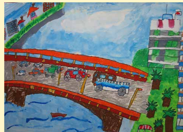
平成26年度金賞作品(小学校低学年の部)