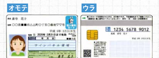
▲個人番号カード(イメージ)

※10月～12月に「個人番号カード交付申請書」をマイナンバーの通知と併せて郵送します。