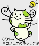
8/31→ ネコノヒゲのキャラクター

4月。朝日を浴びた桜、昼に大きく花開いた桜、ライトアップされた夜桜。皆さんはどんな桜を誰と観に行きますか？そんな桜の風景も春の景観の一つですね。さて、今回は中心市街地における景観啓発と花のコンクール情報をお届けします。