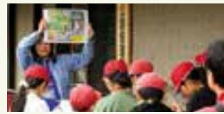
小学生への環境学習