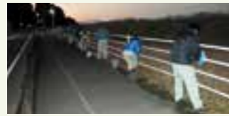
早朝の道路美化活動