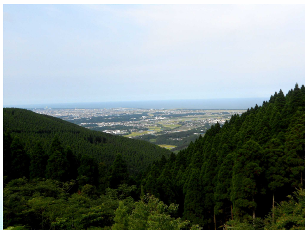
公園内からの景色