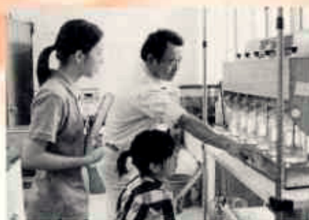
インターンシップ実習生の凝集実験

安全でおいしい水を市民の皆様にお届けするために、水質管理に万全の体制で取り組んでいます。