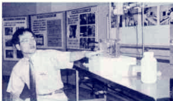
小戸小学校4年生の水道局見学会

浄水場には、毎年4千人を超えるたくさんの市民が訪れ、浄水のしくみなどを見学しています。