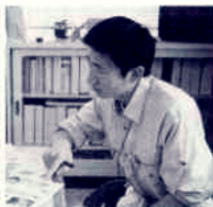
水道実務研修の様子