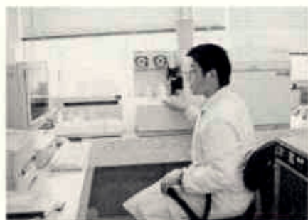
誘導結合プラズマ質量分析装置による検査