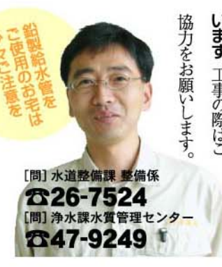
【問】水道整備課 整備係 ☎26-7524 【問】浄水課水質管理センター ☎47-9249

■朝一番の水は飲み水 以外の使用を 上下水道局では、水質基準をクリア した安全な水道水をお届けしてい ますので安心してお使い下さい。し かし、朝一番や長い間留守にした時 には、水が給水管(水道本管から家 庭への引き込み管)に長時間滞留す