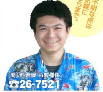
【問】料金課 お客様係 ☎26-7521