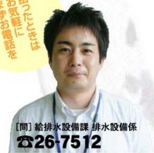
【問】給排水設備課 排水設備係 ☎26-7512

エネルギーの節約など、環境負荷 の低減に役立つ、水道事業に重要な 施策なのです。地上漏水は発見が容 易で、主に住民からの通報が多いです。 漏水の早期発見、漏水箇所を的確 探知し修理作業の効率化を図るた めには、住民の方々のご協力が不可 欠です。ホームページでも「宅地内 で漏水していたら」「道路で漏水して いたら(漏水110番)」を掲載、ご協 力をお願いします。