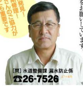
【問】水道整備課 漏水防止係 ☎26-7526

漏水の発見、通報と緊急 漏水修理に対する ご協力をお願い 漏水箇所を早期発見し確実に修理 することは、道路陥没や浸水等の二 次災害の防止、水資源の有効利用等 水を作り出すために必要な薬品や