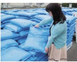
乾燥肥料 1袋15kg入り 50円