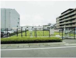
雨水滞水池(柳丸地区)