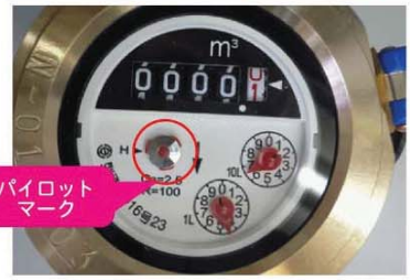
パイロットマーク

設置されているメーターは、局の貸与品となっています。無断で取外したり、破棄しないようにお願いします。また、水道メーターの検針や交換の際、メーターボックスの上物が置かれていますと、作業が行えない場合があります。メーターボックスの上やその周辺には、物を置かないようにご協力をお願いします。