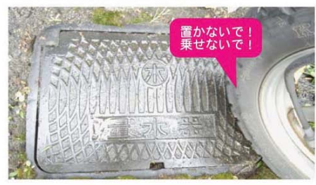
置かないで! 乗せないで!