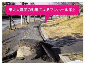
東北大地震の影響によるマンホール浮上