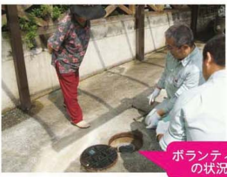
ボランティアの状況

「下水道の日」(9月10日)に合わせ、管工事協同組合主催による排水設備点検及び清掃を、平成12年より指定の工事店にてボランティアを行っています。これは毎年、対象地域を設定し、対象地域の民生委員経由にて事前に希望者(高齢者や独り暮らしの世帯)を募集し、「下水道の日」に近い土曜日又は日曜日に希望者宅の排水設備の点検及び清掃を行うものです。また、点検及び清掃だけでなく、排水設備の仕組みや維持管理の説明、悪質業者等によるトラブルの注意喚起などを行って行っており、下水道排水設備に絡むトラブル防止の啓発にも努めております。