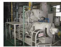
消化ガス発電設備 250kw

地球温暖化防止や循環型社会の構築が重要な課題となっている中、生物起源の有機性資源であるバイオマス資源が注目されています。