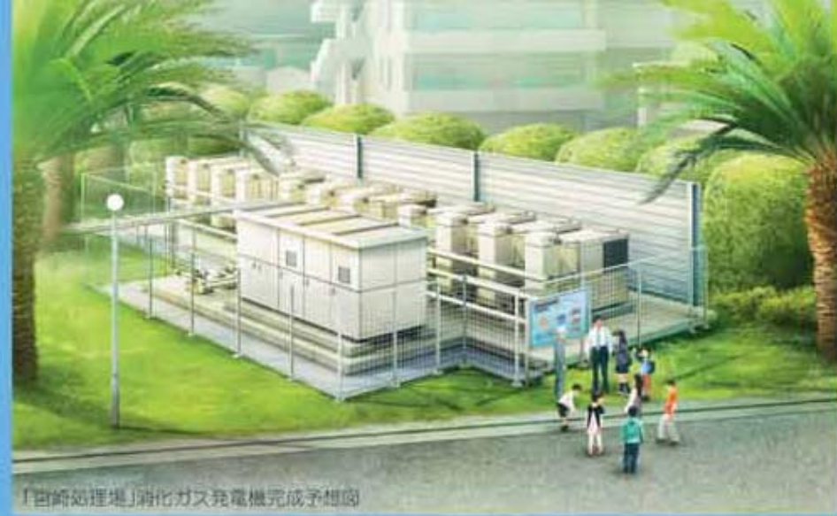
「宮崎処理場」消化ガス発電機完成予想図

下水汚泥から発生する消化ガスで発電 宮崎市上下水道局は、下水処理の汚泥を処理する際に発生する消化ガスを利用した発電を、宮崎処理場で平成6年から行っています。しかし、発電機の老朽化と未利用のままの余剰ガス対策が課題となっていました。この問題を解決