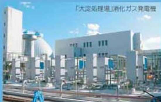
「大淀処理場」消化ガス発電機

環境を考慮してガス発電を導入 大淀処理場では、汚泥焼却設備で使用する重油の代替燃料として消化ガスを利用してきました。しかし、ここでも余剰ガスがあつたため、新たに平成26年4月から200KWの消化ガス発電を開始しました。大淀処理場で使用する電力の15%を賄える予定で、電力会社から電気を購入するよりCO2削減になります。このように、宮崎市の下水処理場では、地球環境に配慮した下水汚泥の有効利用を推進しています。