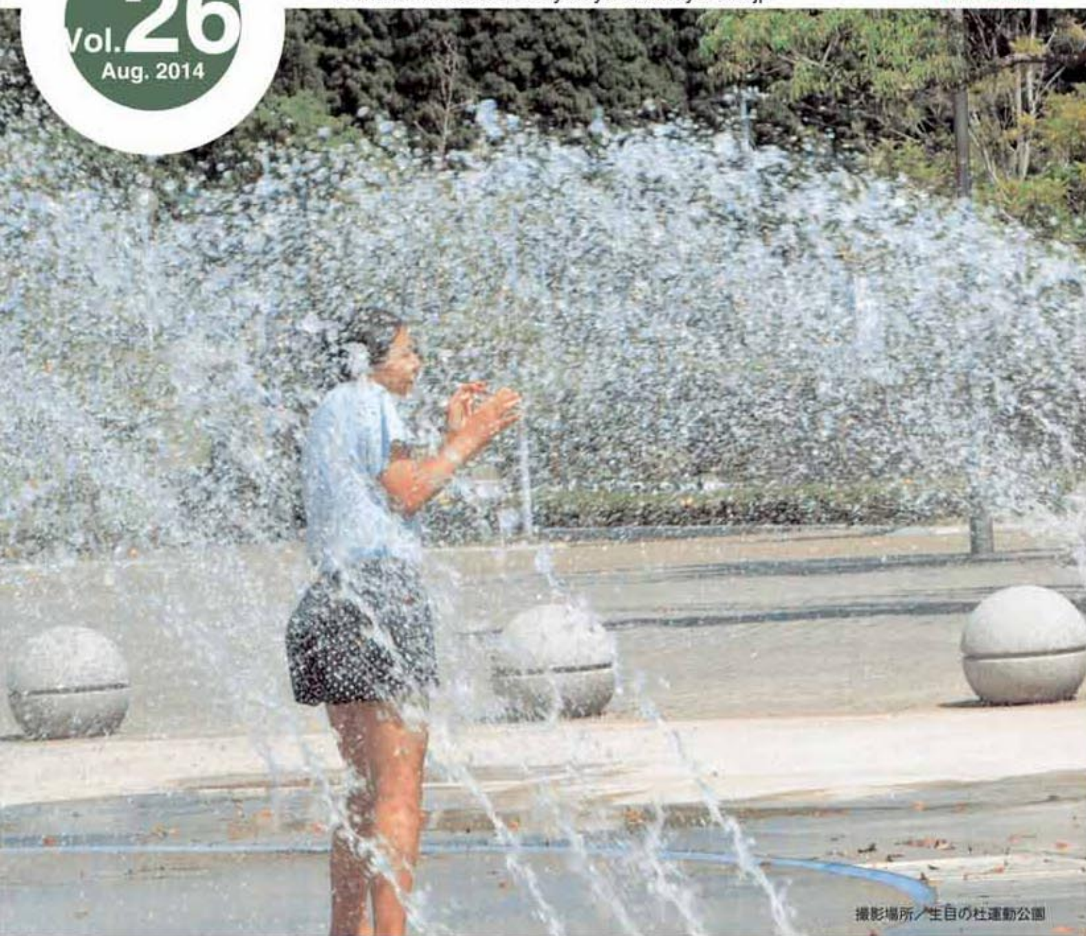
撮影場所/生目の社運動公園