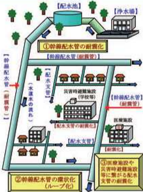
水道管路施設耐震化対策のイメージ図