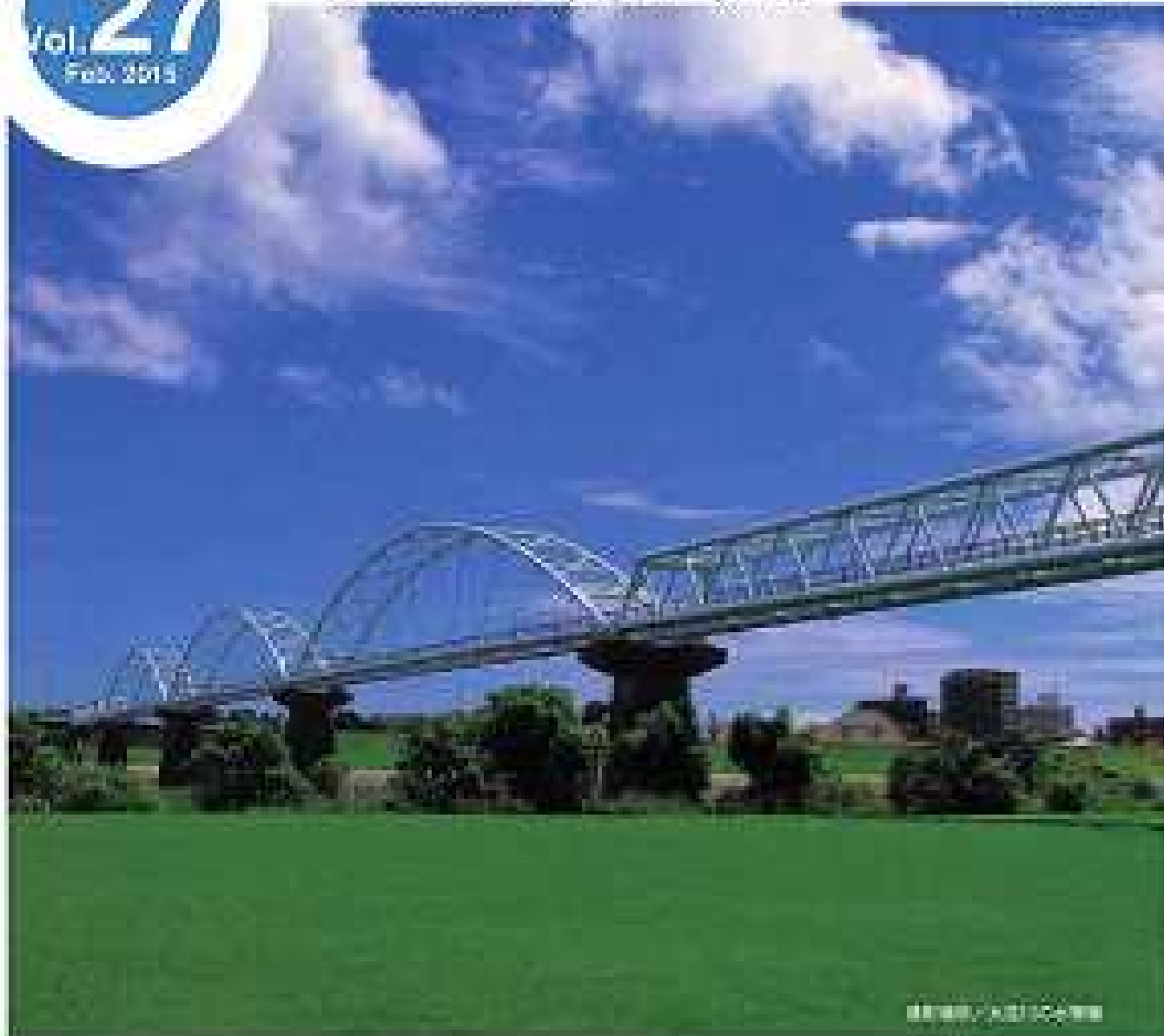
宮崎県立総合体育館