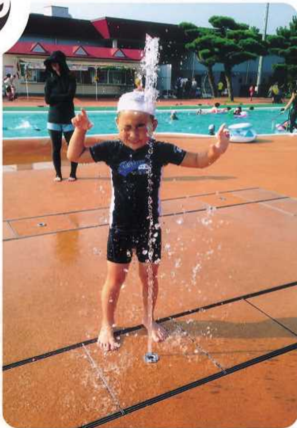
《撮影場所》フェニックス自然動物園／流れるトイレ