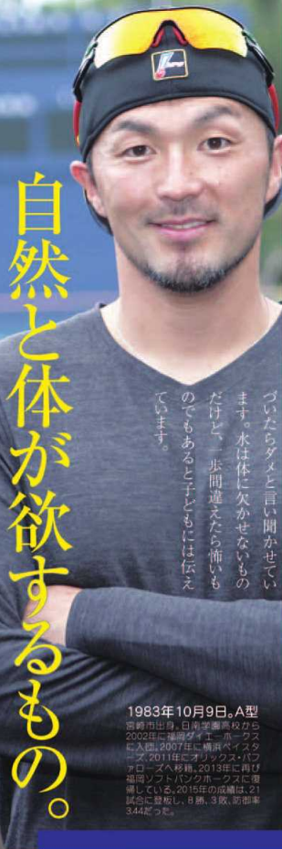
1983年10月9日、A型 宮崎出身。日本野球連盟から2002年に福岡ダイエー・ホークスに入団。2007年に横浜ベイスターズ(2011年にオリックス・バファローズへ移籍)、2015年に現所属の福岡ソフトバンクホークスに復帰している。2015年の成績は、21試合に登板し、8勝、3敗、防御率3.44だった。