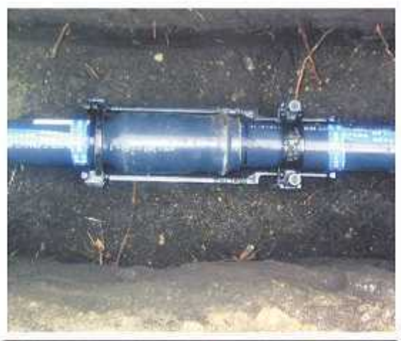
地震・災害に強い水道管を入れていきます