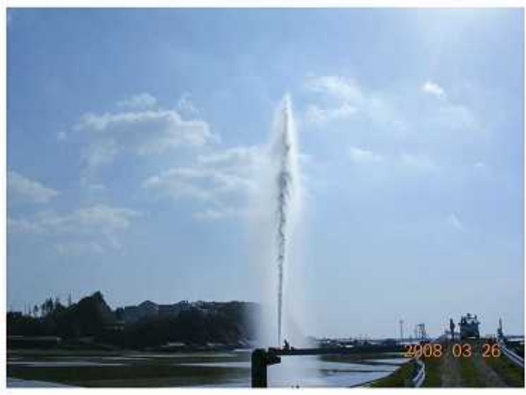
清武川水管橋 φ75mm空気弁漏水写真