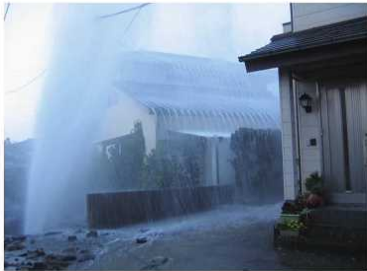
下北方町φ500mmダクタイル鑄鉄管の漏水事故写真