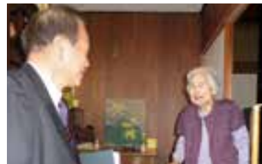
1人暮らし高齢者宅訪問活動

ひと言で言えば、「地域の困り事の相談役」。子どもたちの登下校時の見守り、あいさつ活動、1人暮らしの高齢者宅の訪問などね。地域の人に何かあったとき、どうしてよいか分からないことが起きたときに、私が関係機関とのつなぎ役になるの。