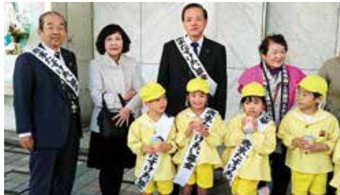
歳末たすけあい募金活動

歳末たすけあい募金への協力、他地区と合同での研修会、健康ふくしまつりでのチャリティーバザー開催など、委員同士の交流や勉強会も行っています！