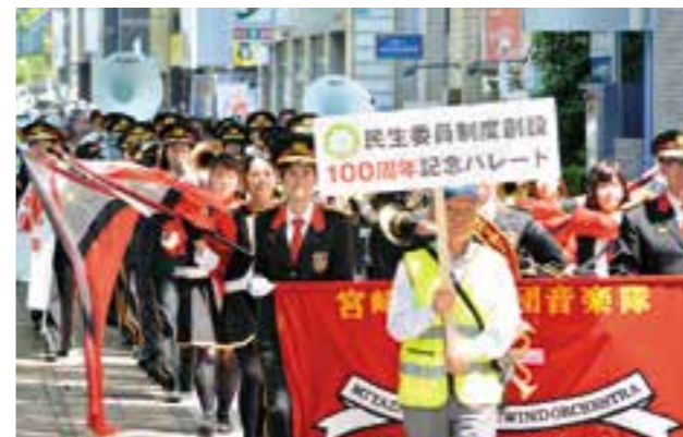
100周年記念パレード

民生委員は、方面委員の頃から母子保護法の補助機関として、また少年教護法における少年教護委員として活動してきました。その実績が認められ、児童福祉法の制定時に民生委員が児童委員を兼任することになり、今日の「民生委員・児童委員」に至ります。