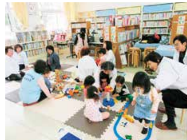
地区社会福祉協議会と協働(子ども一時預かり事業)