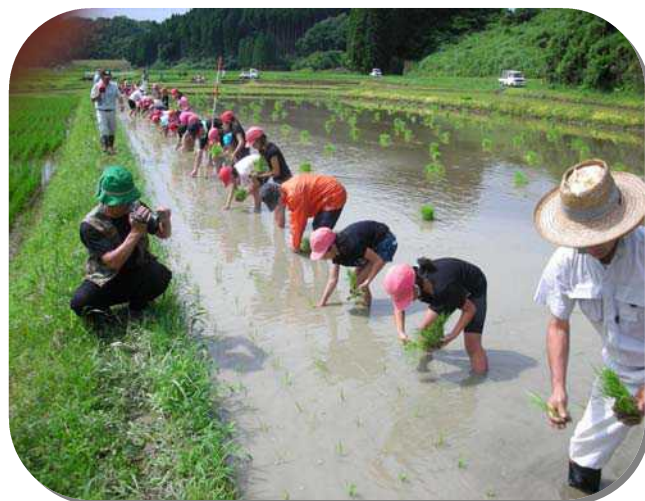
平成 25 年度 地域と学校の連携事業