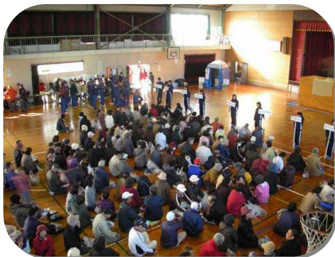
平成 25 年度 大塚台地区防災訓練