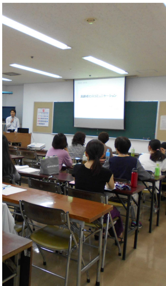
養成講習は、介護職員初任者研修の内容を簡素化した全18時間のカリキュラム

養成講習の受講者は、「身近に住んでいる高齢者を支援したい」「介護の仕事を学んでみたい」「人の役に立ちたい」といった様々な思いで臨んでいました。