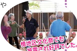
憶地区文化祭でも披露され好評でした。