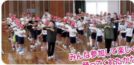
みんな参加して楽しく踊ってくれたかな。

本年度は地区の夏祭りに参加して盆踊りを踊ってもらえる事を願い4年生に踊り・唄・はやし・太鼓の講習を行いました。