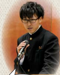
意表を突く学生服姿で登場

平成29年1月8日(日)、憶中学校体育館において、憶地区成人式が開催されました。あいにくの雨模様ではありましたが、ご来賓、恩師、保護者、地域の方々など多数のご出席があり、参加した男性87名、女性83名、計170名の新成人の皆さんの門出を、みんなでお祝いしました。新成人の皆さんは、自己実現や地域貢献のために更に頑張ろうと決意を新たにしていました。