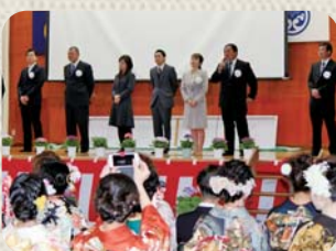
〔恩師からの温かいお祝いの言葉〕