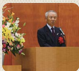
〔憶地区社協井野会長〕