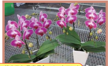
憶地域の代表的な農産品「コチョウラン」