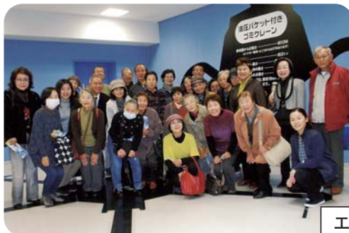
エコクリーンプラザみやざき見学

福祉協力員が組織化された先進地、住吉地区福祉協力員の活動についてや、歴史ある住吉地区社協の説明をしてもらいました。