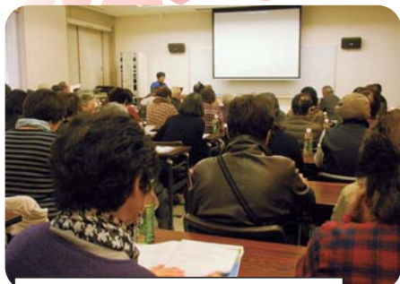
住吉地区社協による説明 (みやざき歴史文化館 研修室)

福祉協力員が組織化された先進地、住吉地区福祉協力員の活動についてや、歴史ある住吉地区社協の説明をしてもらいました。