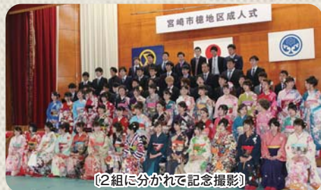
〔2組に分かれて記念撮影〕