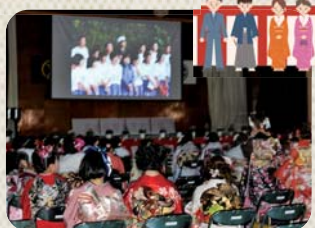
〔サブ委員が作成したスライドショー〕