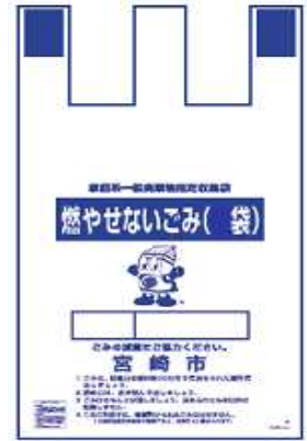
青色の指定ごみ袋