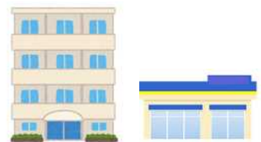
処方された医療機関・薬局へ返却