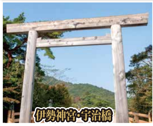
伊勢神宮・宇治橋