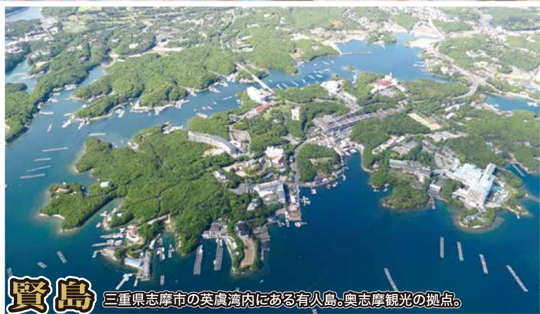
賢島 三重県志摩市の英虞湾内にある有人島。奥志摩観光の拠点。