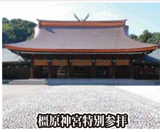
橿原神宮特別参拝