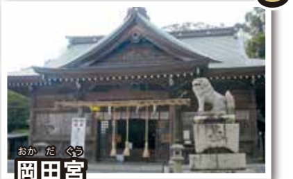
おか だ ぐう 岡田宮