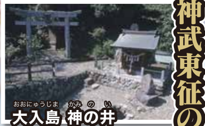
おおにゅうしま かみのい 大入島 神の井