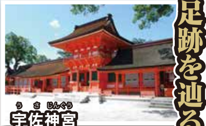
うす じんぐう 宇佐神宮