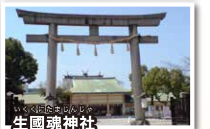
いくくにたまじんじや 生國魂神社